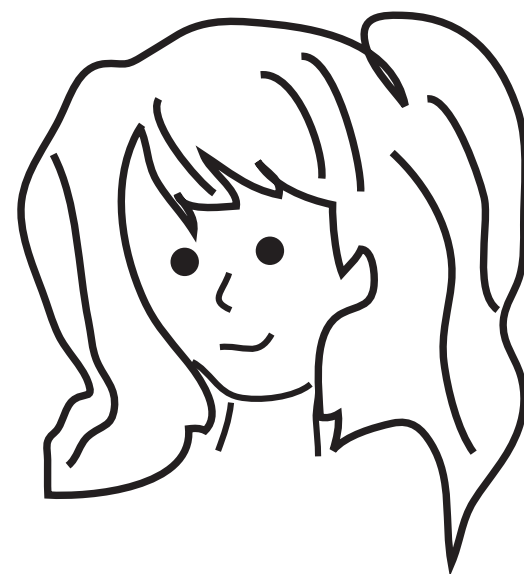
シャーロットプリン