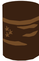
かばざいく 樺細工