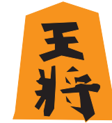
てんどうしょうぎこま 天童将棋駒