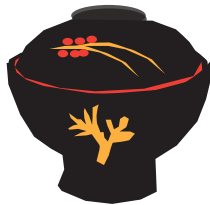
あいづぬり 会津塗