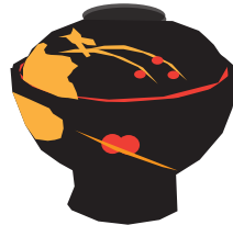
わじまぬり 輪島塗