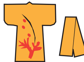
にしじんおり 西陣織