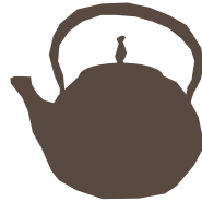
なんぶてつき 南部鉄器