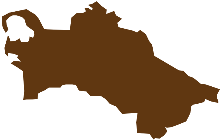
トルクメニスタン