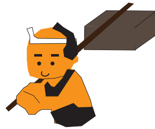
飛脚（ひきやく）手紙をはこぶ