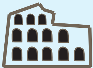
闘技場 コロッセオ